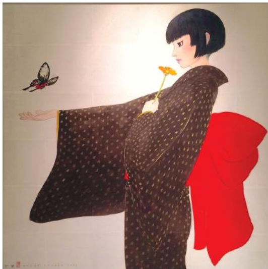
"Ageha" - tecnica mista su seta - 73 x 73 cm

Souske Onoike è un artista originario del Giappone. Soggetti prediletti nel lavoro artistico del pittore giapponese sono delicate figure femminile, avvolte nei tradizionali kimono: indumento caratteristico del Sol Levante che non esalta le curve del corpo, ma la grazia del portamento così come l'armonia e la delicatezza del gesto. In queste opere infatti il potere di fascinazione femminile non è usato in maniera maliziosa o istigatrice, ma come simbolo di una soave e casta sensualità, di una bellezza quasi sussurrata, che si coglie implicitamente in piccoli cenni, nelle pose eleganti o nei dolci sguardi. Nei dipinti di Souske Onoike, raffinatezza, armonia compositiva e delicatezze cromatiche si combinano con i caratteri tipici della pittura giapponese, grazie ai quali è possibile cogliere tutto il fascino e l'essenza di un Paese ancora oggi abitato dalla tradizione e nel quale ogni istante si veste di un silenzio quasi rituale.