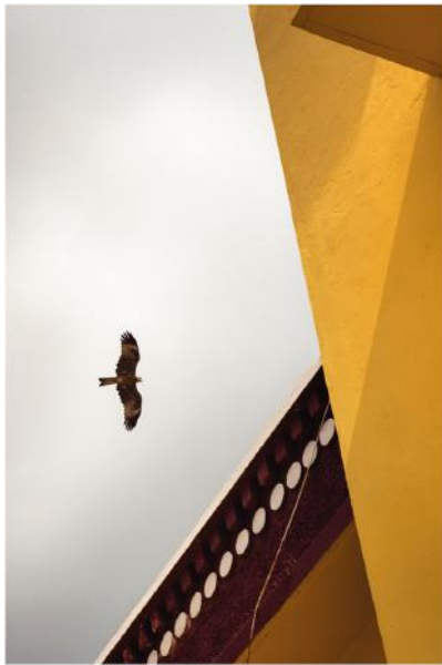
"Within The Mind" - fotografia, stampa Giclée - 51 x 69 cm

TOBI WILKINSON è un'artista australiana. Affascinata dalle potenzialità del mezzo fotografico, si forma a fianco del fotografo Gordon Undy. Sebbene l'artista lavori prevalentemente con pellicole in bianco e nero, le opere esposte fanno parte di una serie di scatti incentrati sui monaci. Da lungo tempo infatti la fotografa australiana si è dedicata ad una ricerca artistica sui monaci di Gyuto del Tibet, fotografandoli nel loro monastero di Dharamsala, in Australia e nel suo studio a Surry Hills.