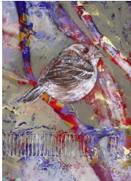
"Wren V" - olio e tecnica mista - 23 x 30 cm